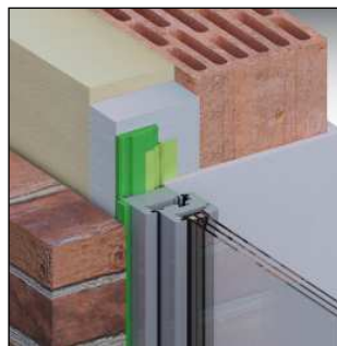
Lösungsmöglichkeit: ME350 Fensterfolie Innen VV FM230 Fensterschaum+ TP600 illmod 600