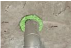
FM710 zur Verwendung bei Hohlräumen in Wänden, an Rohrausbrüchen und tiefen Durchdringungen.