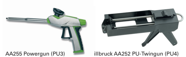
AA255 Powergun (PU3)